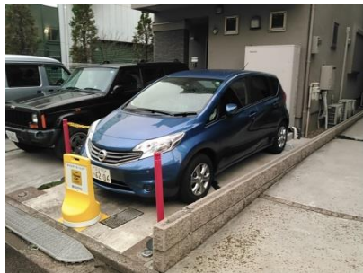
【写真1：タイムズカープラス】